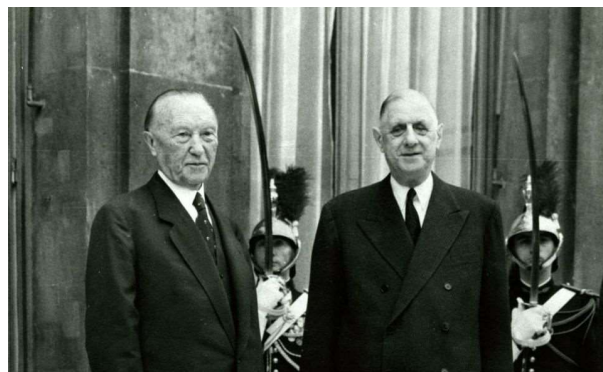
Konrad Adenauer und Charles de Gaulle

Die zwei Staatsmänner haben sich in Frankreich im Jahre 1958 getroffen.