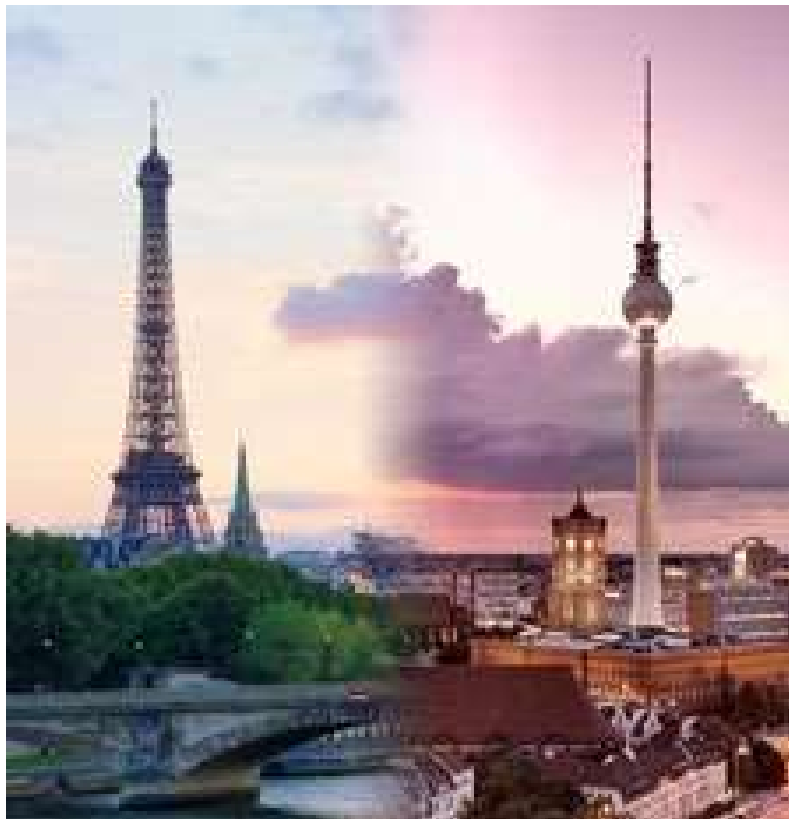
Paris und Berlin

Umfrage = Enquête Gastbeitrag = carte blanche, témoignage U.E Bürokratie = bureaucratie européenne der Vorwartz = l'avant-guerre der Nachkrieg = l'après-guerre dank = grâce à sichern = assurer der Zeuge = le témoignage die Speicher = la mémoire die Verarbeitung = la transformation verwandeln = transformer die Gelengenheit = l'occasion