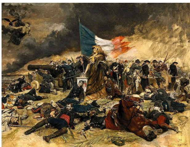
Belagerung von Paris 1870/71

Es gab mehrere historischen Ereignis in der Geschichte von Frankreich und Deutschland. Seit dem Sieg über Napoleon in Jahre 1813 waren die zwei Staaten Gegner. Es gab drei Kriege zwischen Frankreich und Deutschland; 1871, der Erste Krieg im Jahre 1914/1918 und der Zweiten Weltkrieg im Jahre 1939/1945. 1945 kapitulierte das Nazi-Deutschland und ist der Nationalsozialismus gefallen. Deutschland hat einen neue Staat gegründet und andere Länder befreiert ; das war das Ende von der Diktatur und der Anfang von Demokratie. Das ist die Gründung auf eine Versöhnung.