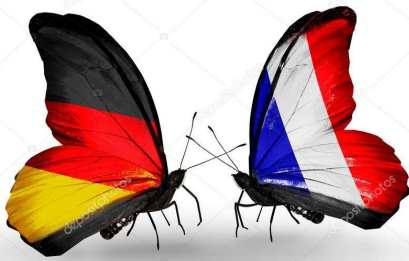
Eine entstehende Freundschaft

Am 22. Januar 1963 wird der Elysee-Vertrag von Charles de Gaulle und Konrad Adenauer in dem Elysee-Palast in Paris unterzeichnet. Diese Vertrag hat ein unmögliche Europa in eine Einigung Europas dank seine mehrere Ziele verwandeln. Zum Schluß ist das ein politische Vertrag, um Sicherheit zu sichern, und um sich besser zu verstehen. Dann das ist für die Erziehung und Jugendfragen, und das also mit der Außenpolitik helfen, um sich zu konsultieren. In der Tat wir entscheiden zusammen besser seit 1963. Mit diesem Vertrag ist alles einfacher und es symbolisiert den Frieden zwischen den zwei Ländenen.