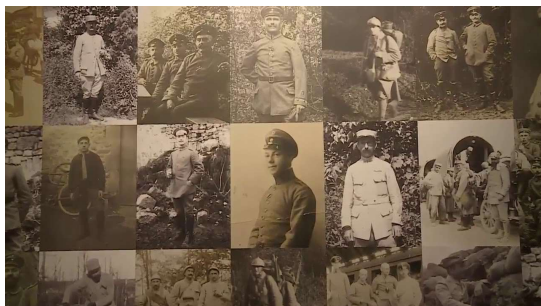
Fotos von französischer und deutscher Soldäten, zu erinnern ihnen

Seit dem Elysee-Vertrag im Jahre 1963 waren die Beziehungen zwischen den neuen Polistichespartnern nicht nur für die zwischenstaatlichen Verkehr. Das heißt dass mehrere Programme waren von Frankreich und Deutschland gegründet, als der DFJW/OFAJ, das Deutsch-Französisches Jungenwerk ist. Also, diese Organisation bietet mehrere Programme an, wie das Brigitte-Sauzay Programm oder Voltaire-Programme. Das Prinzip somit ist ein Schüleraustausch mit zwei Austauschpartnern : der erste ist Französe und der zweite ist Deutsch. Das ist also eine interkulturelle Erfahrung in dem Nachbarland, ein neues Schulsystem und die Sitten und Gebrauchte um zu entdecken. Dieses Programme sind sehr bereichernd für die Schülern geben die Gelegenheit, an etwas teil zu nehmen.