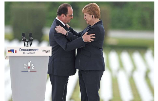
Angela Merkel und François Hollande in Douaumont in Jahre 2016